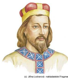
(c) Jilina Lockarová - raklatatlatní Fragment

Konvent sester dominikánek, Černá 14, 110 00 Praha 1