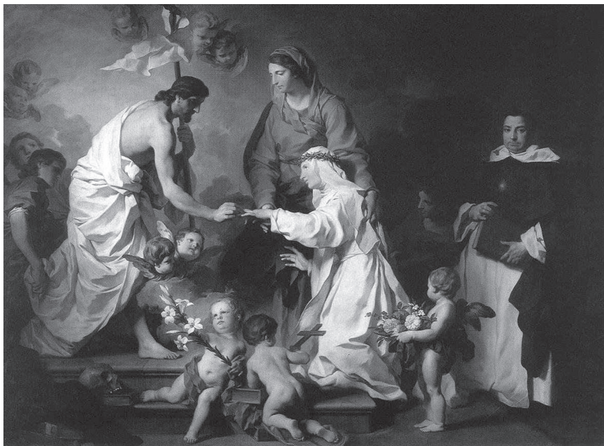
Pierre Subleyras: Mystický sňatek svaté Kateřiny z Ricci (1745).

nic nového, už druhý magistr řádu Jordán Saský učil, že „plná nádoba se ničím nenaplňuje, nýbrž napřed se vylévá, co v ní bylo, aby se mohla naplnit něčím jiným. Svatí apoštolové byli naplněni Duchem svatým proto, že byli vyprázdněni od svého vlastního ducha“. Kvietismus však hlásal, že všechna naše aktivita je od počátku špatná, protože brání Boží aktivitě, a tedy si musíme sednout a sedět jako knedla a čekat, až Bůh sám v nás začne konat veliké věci. A jestli neumřeli, tak kvietisté sedí dodnes, protože takhle to nefunguje. Vždycky platilo „člověče, přičiň se, a Bůh ti požehná“.