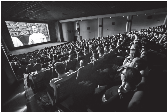
Premiéra filmu Psi Páně.

„Kdo to jsou dominikáni a co tady v 21. století vůbec dělají? Jejich hlavním posláním je hlásat křesťanskou víru. A být s člověkem dnešní doby. Zajímá to ale ještě člověka dnešní doby?“ ( www.psipane.cz )