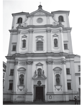
Kostel svatého Vojtěcha v Ústí nad Labem

Podklady k vytvoření výstavy pochází částečně z fondu Muzea města Ústí nad Labem. Velkou část exponátů a materiálů zapůjčila Česká dominikánská provincie (ve spolupráci se SOKa Litoměřice), NPÚ ÚOP v Ústí nad Labem, Archiv města Ústí nad Labem a Biskupství litoměřické. S organizací výstavy zásadně pomohlo místní sdružení dominikánských terciářů v Ústí nad Labem a Česká kongregace sester dominikánek.