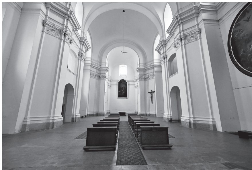
Interiér kostela svatého Vojtěcha v Ústí nad Labem.

Mgr. Martina Vodáková Muzeum města Ústí nad Labem