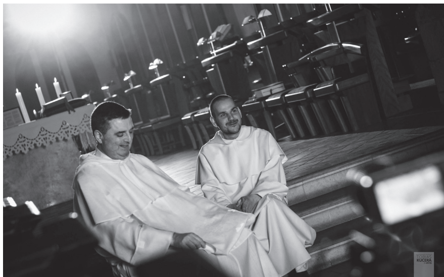
Z natáčení dokumentu Psi Páně.