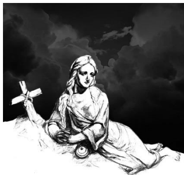
Henri-Dominique Lacordaire OP Svatá Maří Magdalena