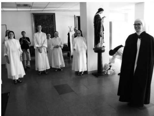
Sr. Guzmanova OP