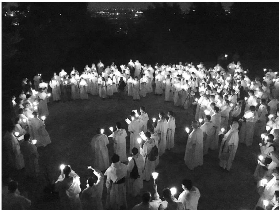
Světelný průvod účastníků putování po stopách sv. Dominika a kapitulářů