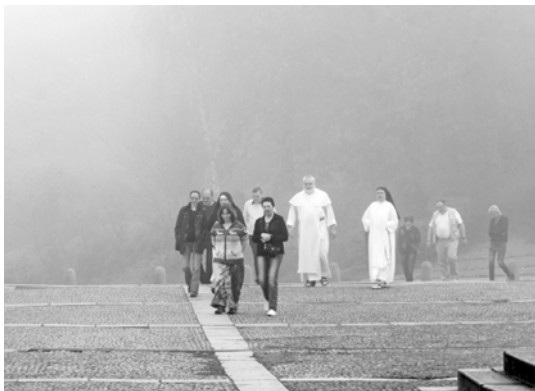
Možná trochu tápeme v mlze, ale odhodlaně

Svatá Hora u Příbrami 25.–27. dubna 2014