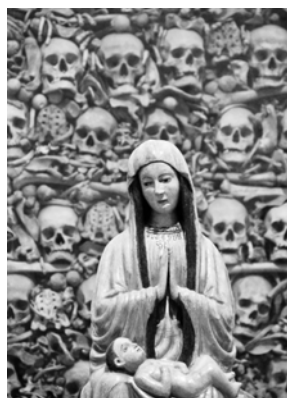
Ostatky mučedníků z Otranta

Není znám přesný počet lidí, kteří tehdy zemřeli pro svou víru. Tradice uvádí 800 mučedníků. Ještě obtížnější je zjistit jejich jednotlivá jména, tím spíš, že jejich mučednická smrt byla vždy vnímána jako společné jednání na obranu víry. Jako jednotlivci jsou známi pouze Bohu. Dochoval se jen neúplný seznam, na jehož začátku je jedno jméno: Alessandro Longo, dominikán. Pravděpodobně tehdy bylo