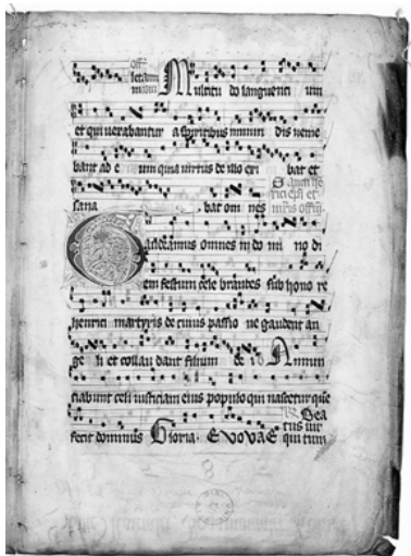
List z misálu, který přežil požár Turku

28 lidí tu noc zemřelo, stovky lidí byly zraněny, 11 tisíc lidí zůstalo bez střechy nad