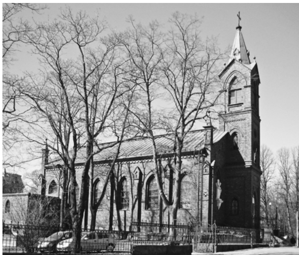
Katolická katedrála sv. Henrika v Helsinkách.

„Lomoz zbrání dozněl, kteréž po 30 let celou skoro Evropu pustošily, na místě velebných chrámů a tichých útočišť zbožné mysli truchlivé zříceniny zůstavivše. Po krutém zápasu umdlely obě strany, tak že jim krvavé meče téměř z rukou klesly, a tu započal teprva pravý zápas o duchovní klenot pravé víry. A když prvé se byl proud bludného učení z krytu klášterního vyřinul a velikou část lidstva zaplavil, byloť nyní jako