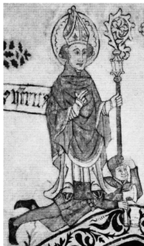
Biskup Henrik.

V 90. letech 13. století pak byla část ostatků přenesena do katedrály v nově založeném městě Turku, které bylo do roku 1827 hlavním městem Finska. Katedrála byla zasvěcena Panně Marii a svatému Henrikovi. Už kolem roku 1249 byl v blízkosti katedrály vystavěn dominikánský klášter zasvěcený svatému Olafu a špitál Sv. Ducha. Při klášteře byla vyhlášena škola, jejíž absolventi byli dobře připraveni na studia ve všech evropských univerzitách. Roku 1398 byl založen druhý dominikánský klášter ve Viipuri (Vyborg, severní Karelíe, dnes na území Ruska). Jaký vliv měli dominikáni na mladou finskou církev je vidět jednak ze zachovaného misálu, neboť biskupská mše byla sloužena podle dominikánského ritu, a má se za to, že čtvrtý finský biskup Tuomas (1225–1245) byl dominikán.