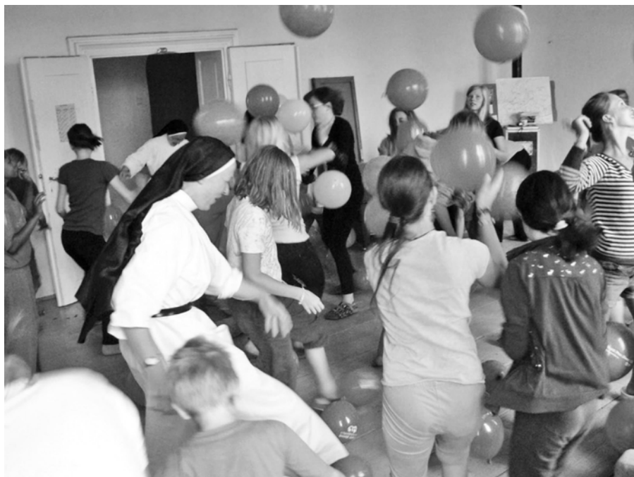
Noví evangelizátoři v akci.