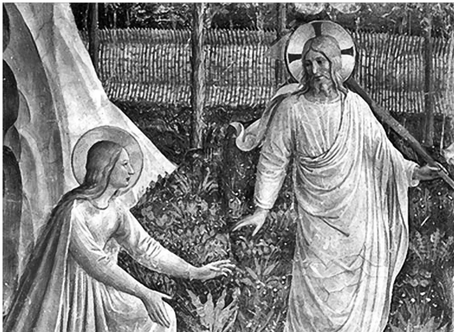
Fra Angelico: Noli me tangere, detail (1425–1430).

„Jdi k mým bratřím a oznam jim...“ Skrze toto posláni žádá Kristus od Marie a ostatních, aby se podílely na zrození církve z kázání. To nás vede k prvnímu předpokladu, že kázání bude základem řádu. Na začátku tohoto nového dobrodružství evangelizace, vedeného Dominikem, se k němu v první řadě připojují ženy, následované laiky. Poskytují nám tak obraz evangelizačního úsilí – druh „malé církve“, komunity sjednocené silou mluveného slova, jejíž členové se shromažďují, aby slovu společně naslouchali a předávali ho světu. Tak, jak to podle Lukáše (8,1–4) bylo i v případě Ježíše, se komunita shromáždí právě v té chvíli, kdy má předpoklad stát se „komunitou pro evangelizaci“. Od samého počátku, i když se to v té době mohlo zdát zvláštní, byly ženy součástí společenství, jež se shromáždilo kolem Ježíše. Jde-li o to být učedníkem, není zde prostor pro světské kategorie. Představme si komunitu, jež se formovala během následování Ježíše na první cestě evangelizace. Překračovala slabosti, selhání, hříchy a křehkosti, které může vyléčit jen Ježíš. Posvátné kázání je ustanoveno z jeho milosti, již lze zakoušet mnoha různými způsoby. Učedníci, kteří Ježíše viděli žít a učit, měli pravděpodobně mnoho příležitostí k tomu, aby se podělili o zážitky z osobních setkání s ním. A ženy z evangelia měly možnost vydat svědectví Slovu, které jim bylo adresováno – Slovu, jež ohlašuje zmrtvýchvstání, uznává víru a příslib spásy, Slovu života a odpuštění,