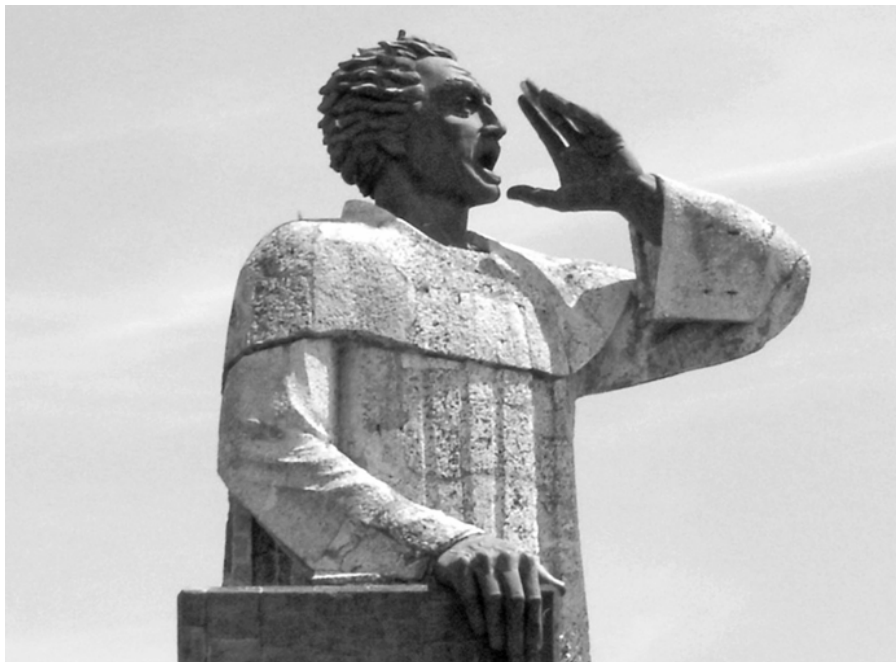
Socha fr. Antonia de Montesinos v Santo Domingo v Dominikánské republice