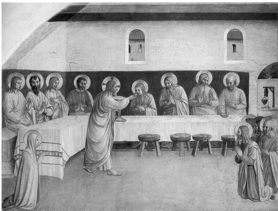
Fra Angelico: Ustanovení eucharistie (1450)