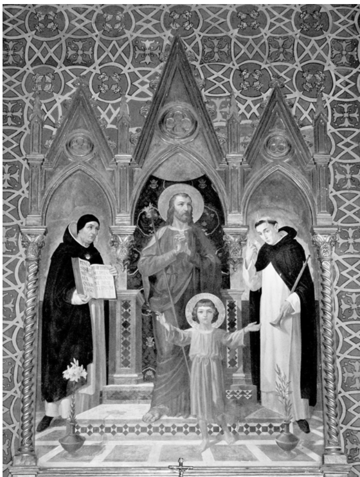
Sv. Tomáš Akvinský na oltářním obraze v dominikánském kostele Panny Marie Růžencové v Římě