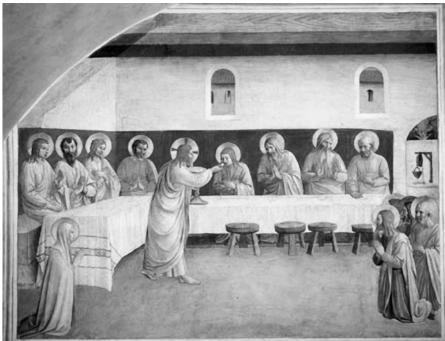
fra Angelico: Poslední večeře (1442)