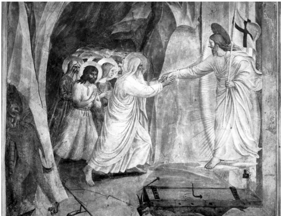
fra Angelico: Zmrtvýchvstalý Ježíš osvobozuje spravedlivé z předpekli (1437–1446)

Milé sestry, milí bratři dominikánské rodiny!