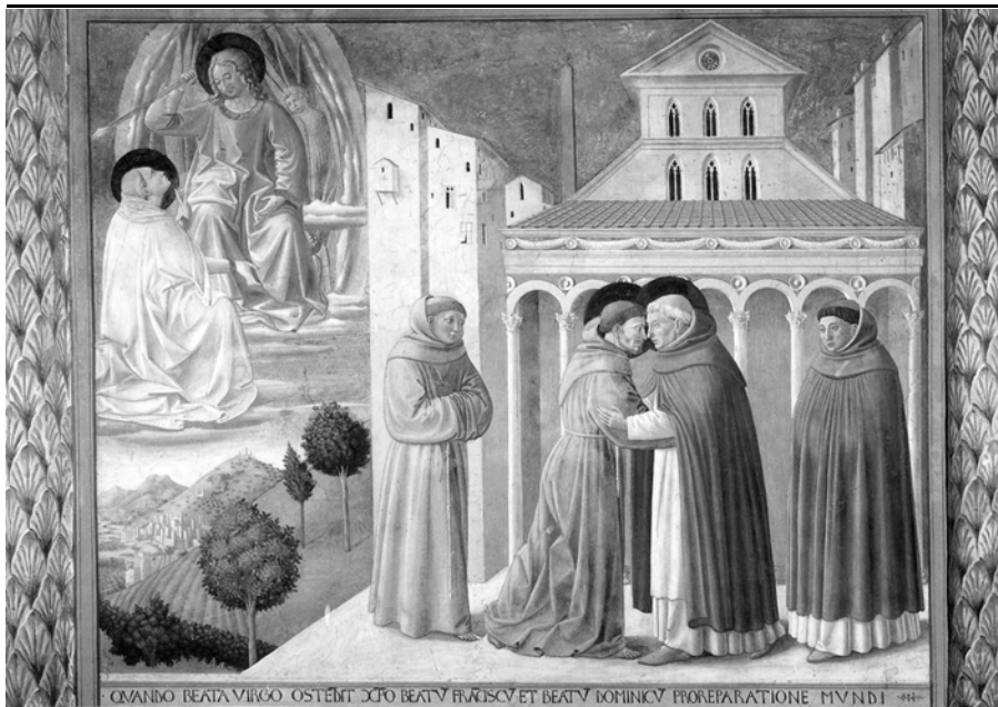
Benozzo Gozzoli: Setkání Františka s Dominikem (1452).

princip zla jako rovnocenný Bohu. Tato hnutí měla úspěch zvláště ve Francii a v Itálii, nejenom svou pevnou organizací, ale také proto, že poukazovala na reálný nepořádek v církvi, způsobený málo příkladným jednáním různých exponentů z řad kléru.