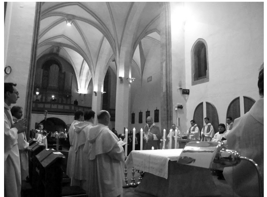
Mše svatá na zahájení provinční kapituly