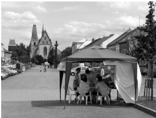
Letní misie v Rakovníku 2009.

Protože letos nás čeká výrazně větší město, a jak doufáme i větší misijní tým, vzrostou výrazně i finanční nároky na zajištění celé akce. Největší podíl příjmů vždy tvoří příspěvek provincie a účastníků misie. Protože ale pro mnohé z nich je misie sama o sobě výrazným zásahem do jejich životů a s ní spojené náklady opravdovým břemenem, a protože není ani provincii možné více zatěžovat vyšší finanční spoluúčastí na celé akci, prosíme vás o finanční příspěvek podle vašich možností, byť by se zdál z prvního pohledu malý. Protože i „vdovin haléř“ byl více než zlatáky farizeů. Dar je možné poukázat na bankovní účet České dominikánské provincie 6375022/2700, s variabilním symbolem 64743. V případě potřeby na něj můžeme vystavit potvrzení pro daňové odpočty.